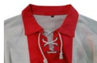
CUELLO CON CORDONES