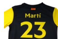
NOMBRE Y NÚMERO PERSONALIZADO