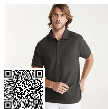
PEGASO PREMIUM PO6609