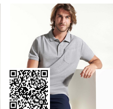
CENTAURU PREMIUM PO6607