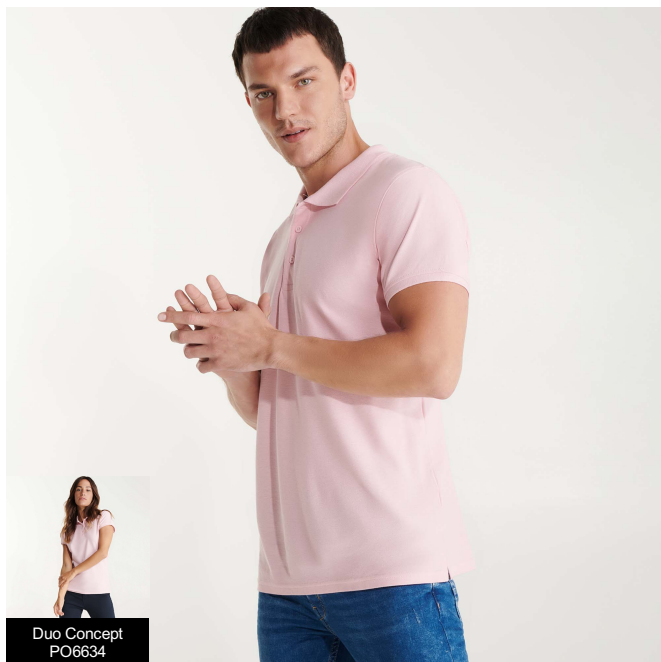
Duo Concept PO6634