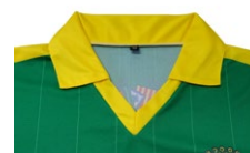
COLL DE PIC ESTIL POLO