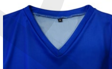
COLL DE PIC