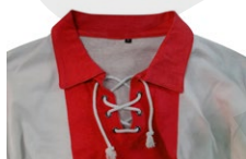
CUELLO CON CORDONES