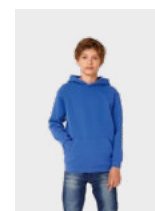
EXISTE DE KIDS: B&C HOODED /KIDS