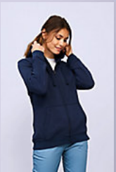
SOL'S SPIKE WOMEN 03106