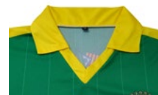
COLL DE PIC ESTIL POLO