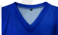
COLL DE PIC