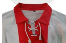
COLL AMB CORDONS