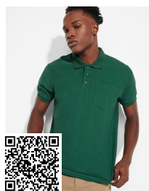
CENTAURO PREMIUM PO6607