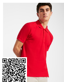
PEGASO PREMIUM PO6609