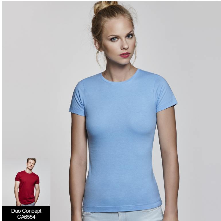
Duo Concept CA6554