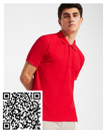
PEGASO PREMIUM PO6609