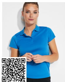
MONZHA WOMAN PO0410